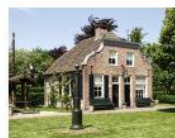
Het programma van deze dag moet nog precies worden opgesteld, maar zal er ongeveer als volgt uitzien: