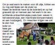
Om je vast want te maken voor dit uitje, schenken we nu nog wat tips van de stuur op. Naast de levende haren bij de boerderij en op het grasveld zijn er mensen aan het werk in de verschillende ambachtshuizen zoals toen: werven in het veevrijhuis, een prachtige koperenmakerij en een houtzagerij. En misschien krijgen we ook te zien hoe beter en kaas gemaakt worden en hoe brood gebakken wordt zoals vroeger.